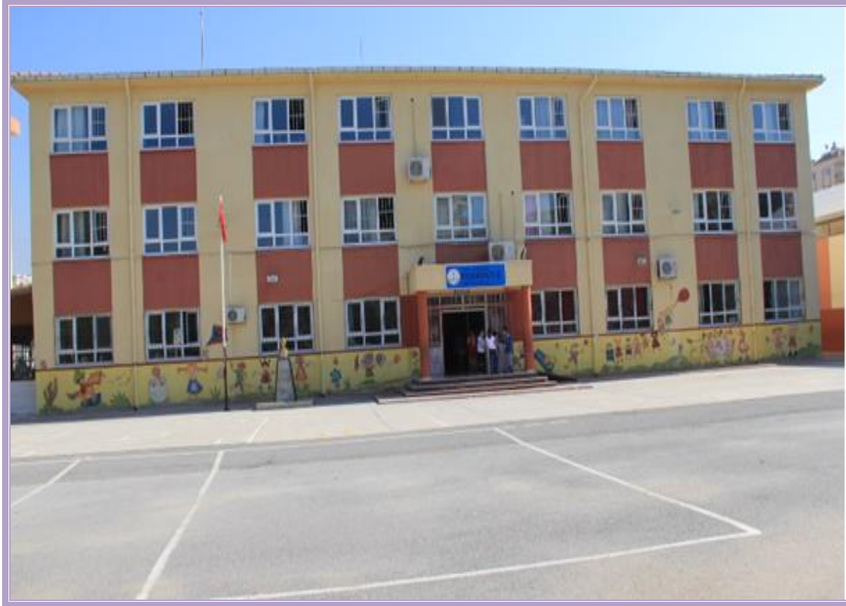
EGEKENT 2 ORTAOKULU